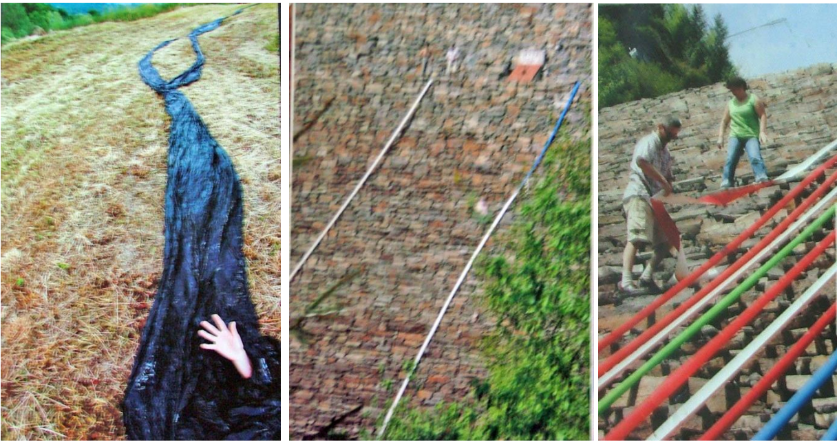
Imagini lucrări iconostas Biserica Sf. Gheorghe